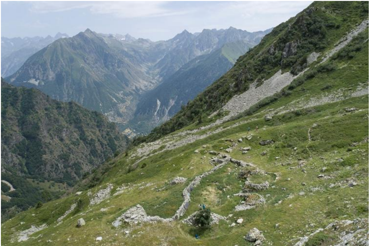
Fig. 01 : Site des Six Cabanes, prise de vue depuis le nord-ouest.