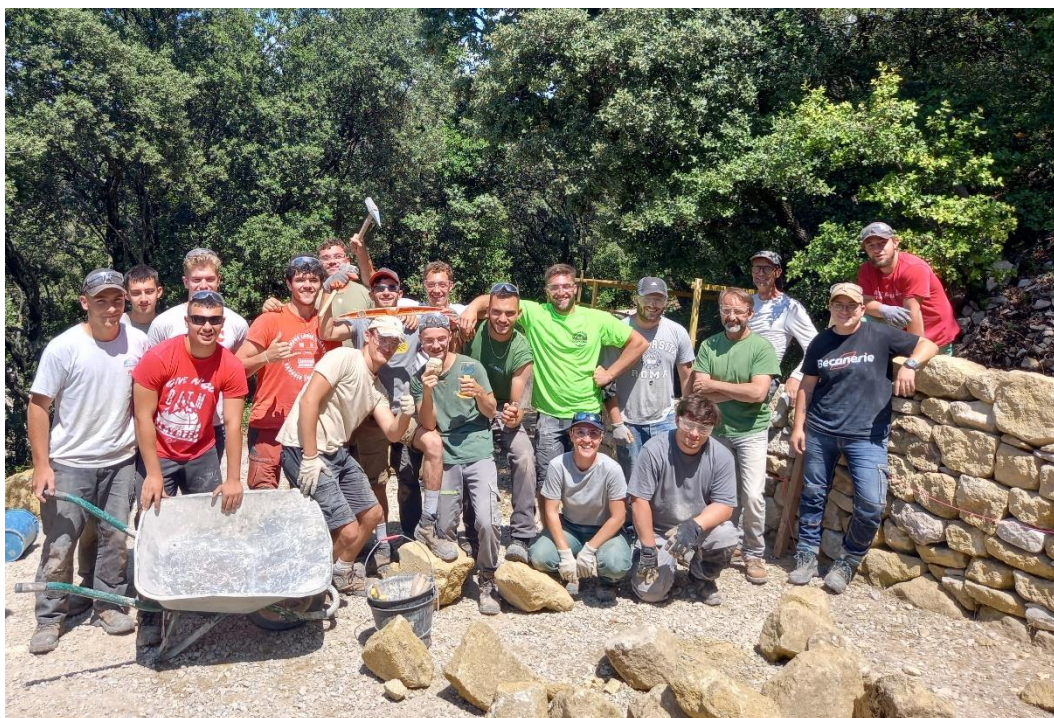
Fig. 4 : session BTS 2023