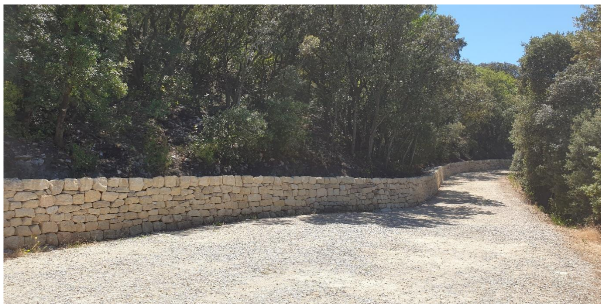
Fig. 9 : mur fini