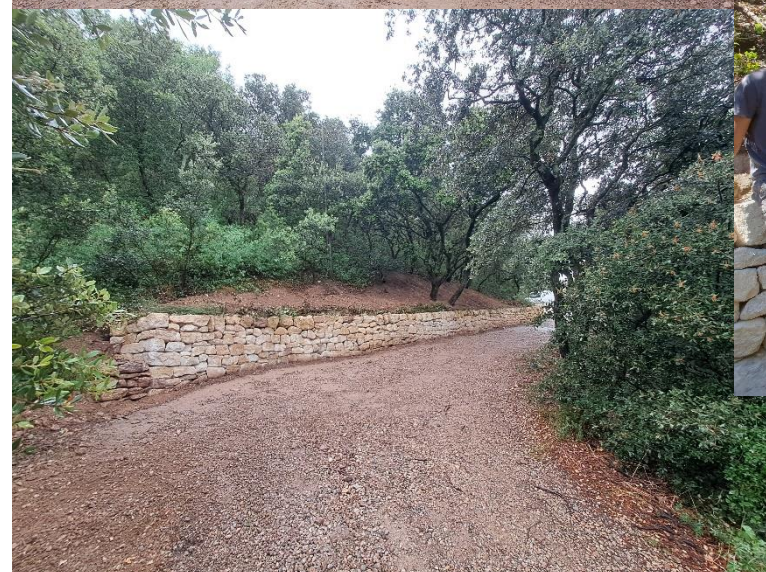
Fig. 10 à 13 : mur fini Fig. 14 : session BPA-TAP 2022