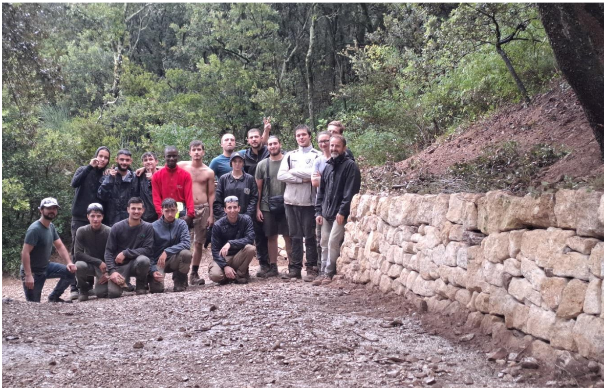
Fig. 16 : session BTS-AP 2024