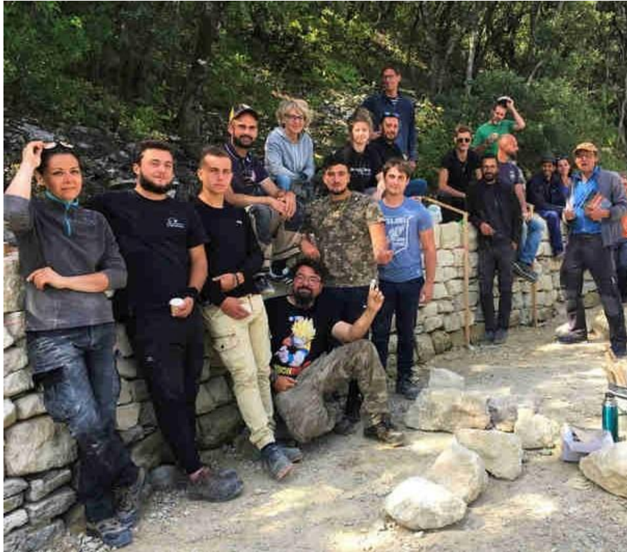
Fig. 15 : BTA-TAP session 2021